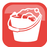
UMIDA / WET

Ordinary dry cleaning is most frequent and it can be done daily to remove dust and any kind of abrasive agent, as sand, small pebbles and hair.