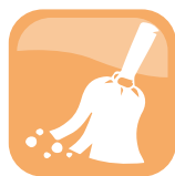
SECCO / DRY

In general, ordinary cleaning is divided into ordinary dry cleaning and ordinary wet cleaning .